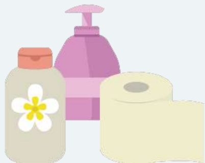
ПАРФЮМЕРИЯ, КОСМЕТИКА И ГИГИЕНА

Категории продуктов, которые занимали наибольшую площадь на страницах каталогов