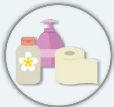
ПАРФЮМЕРИЯ, КОСМЕТИКА И ГИГИЕНА