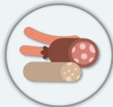
КОЛБАСНЫЕ ИЗДЕЛИЯ/ КОНСЕРВИРОВАННЫЕ ГОТОВОЕ МЯСО