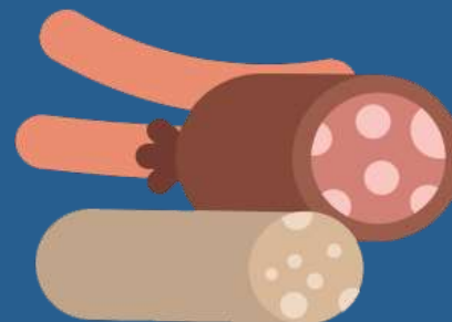
КОЛБАСНЫЕ ИЗДЕЛИЯ/ГОТОВОЕ МЯСО